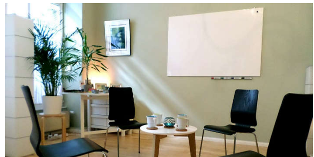
Bild: Praxis Ausbildungsraum